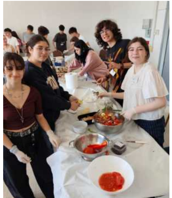
(Oben: Schulbalkon, Foodworkshop)