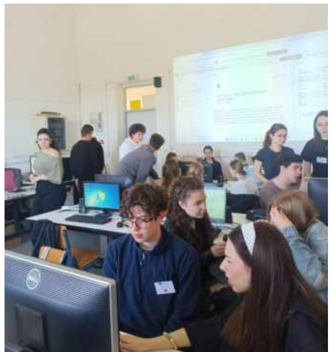
(Digitaler Workshop zu Nachhaltigkeit)