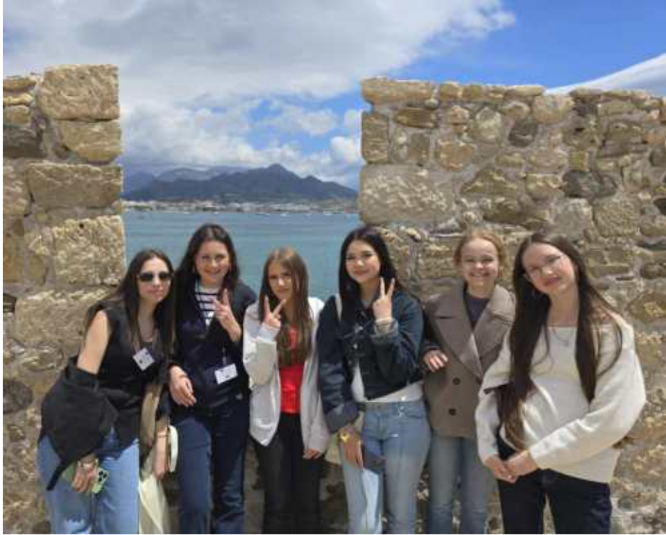
(Impressionen von Ierapetra)