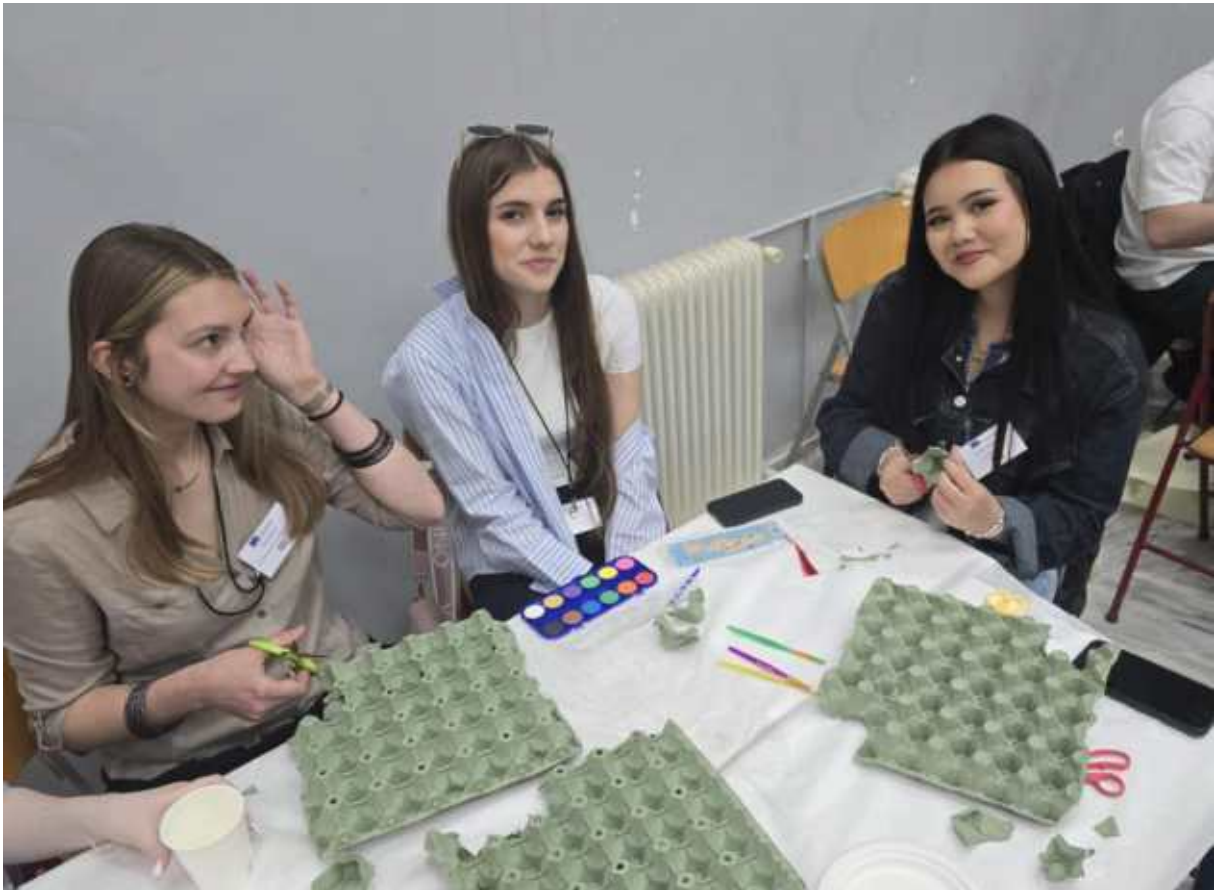
(Workshop: Erasmusblumen aus alten Eierkartons basteln)